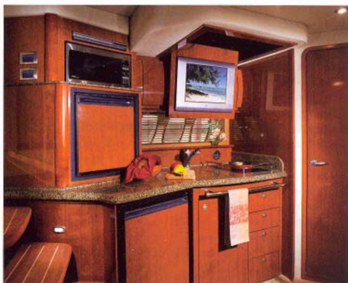
Pantryet om bord imponerer med alt af udstyr "the american way". Ud over mikrobølgeovn, rigtig ovn, keramikblus og ismaskine, frys og stor køl er der også et fladskærms-tv monteret. Man skal ikke mangle underholdning, mens man tryller med gryderne. Lidt større arbejdsflade ville dog være et plus.

Der følger kalecher med, som kan lukke mellem åbningen over frontvinduerne, udstyret med kraftige vinduesviskere, og hardtoppens front. Desuden