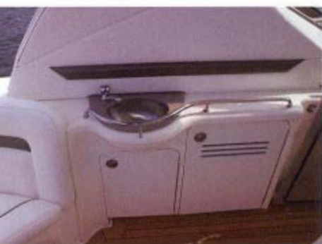
Om bagbord finder man en lille praktisk bar, der byder på et skab til de gode varer, køl, vask, k/v vand og lidt plads til at blande de rigtige drinks til de rigtige folk.

og opvask, køleskab, fryser, ismaskine, kraftig ventilation, over- og underskabe, skuffe og en god høj nok arbejdsbord for kokken.