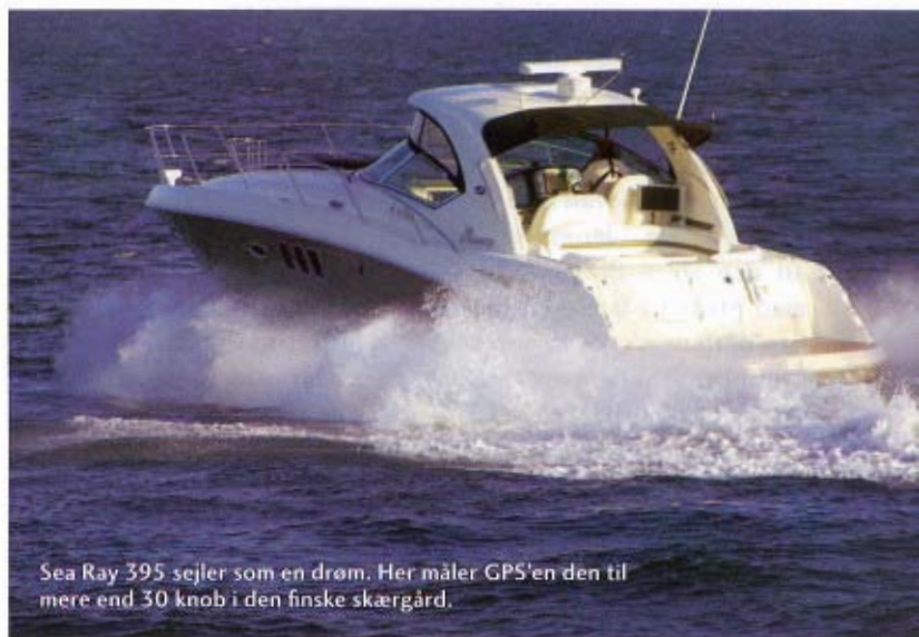
Sea Ray 395 sejler som en drøm. Her måler GPS'en den til mere end 30 knob i den finske skærgård.

Man har valgt at lægge det meget flotte og veludstyrede pantry om bagbord. Dette er i træ og ser meget lækkert ud. Her er selvfølgelig en mikrobølgeovn, en rigtig ovn, to blus gasbrændere, to vaske til skyl ▶