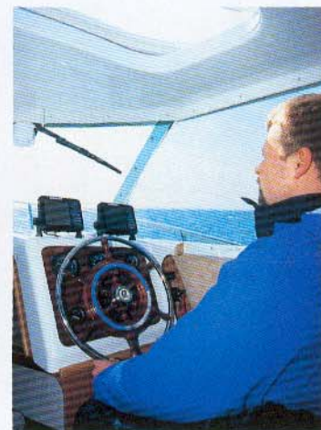
Bemærk det gode, store skydetag lige over førerpladsen. Den er glimrende indrettet, og man sidder højt hævet med et godt udsyn.