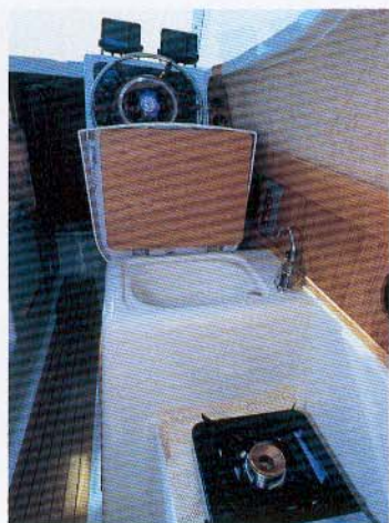
Pantryet består af en lille plan flade til et gasblus, og under førersædet er der en lille håndvask med et godt skab under.