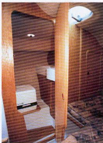
Toiletrummet med det kemiske toilet er trangt, men det er pænt udført, og det vil fungere fint i praksis. Det er dog lidt mørkt.