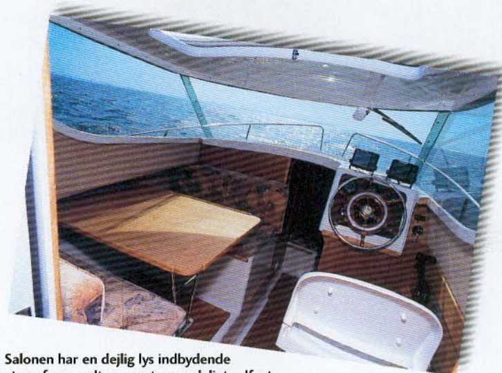
Salonen har en dejlig lys indbydende atmosfære – alt er pænt og nydeligt udført.

Quicksilver 650 Camping er en dejlig båd. Den vil fungere fint for et par eller en familie med et eller to mindre børn. Båden er