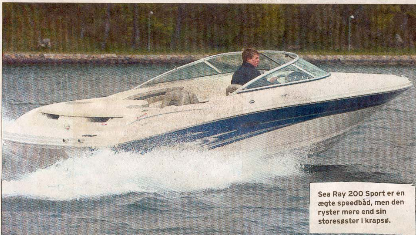
Sea Ray 200 Sport er en ægte speedbåd, men den ryster mere end sin storesøster i krapsø.