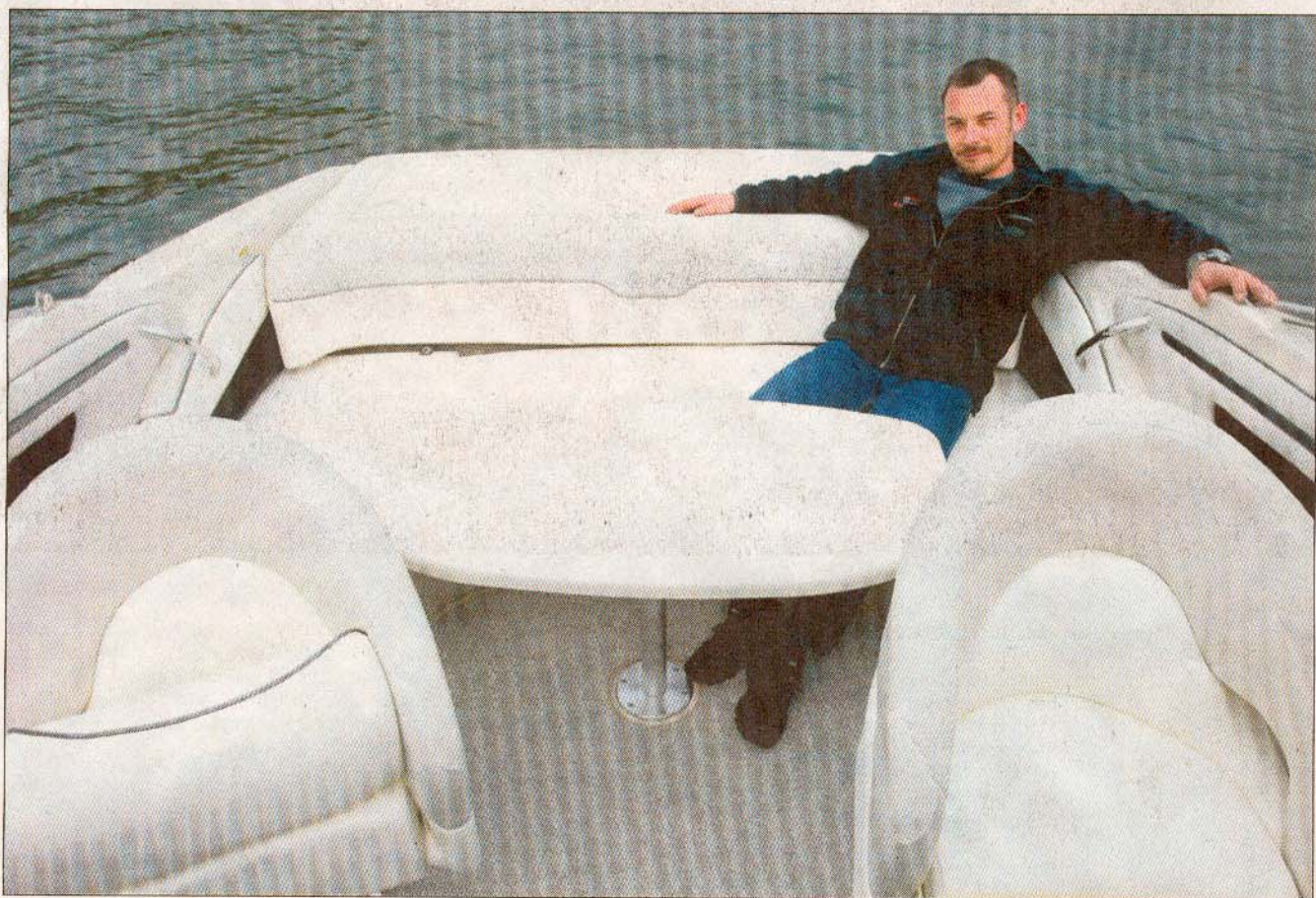
Der er god plads i overnatterens luksuriøse cockpit.