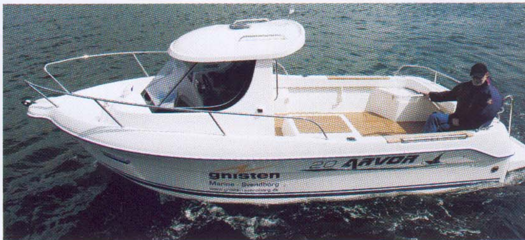
Båden har to smalle køjer. Ventilation fås gennem en lille trækluge i taget og et lille oplukkeligt vindue ved førerpladsen.