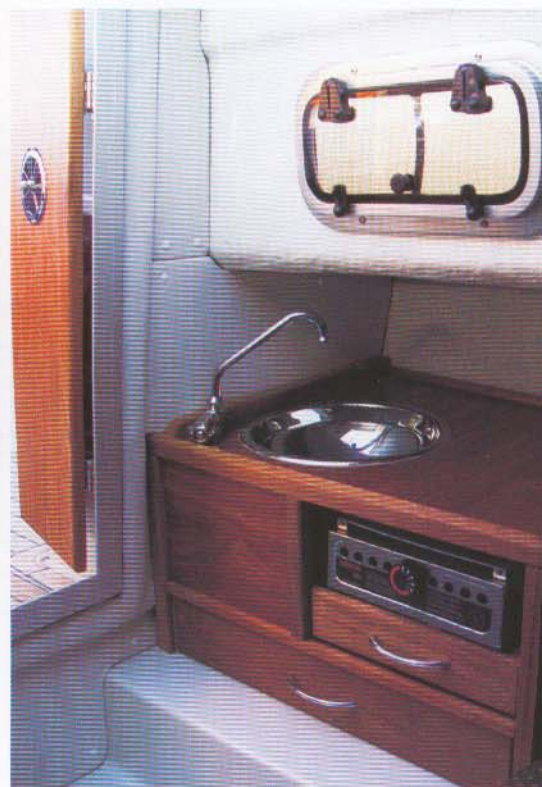
Når kahytsslugen blev lukket blev nøglen klemt og kunne let knække. Efter testen ændrede Askeladden systemet.